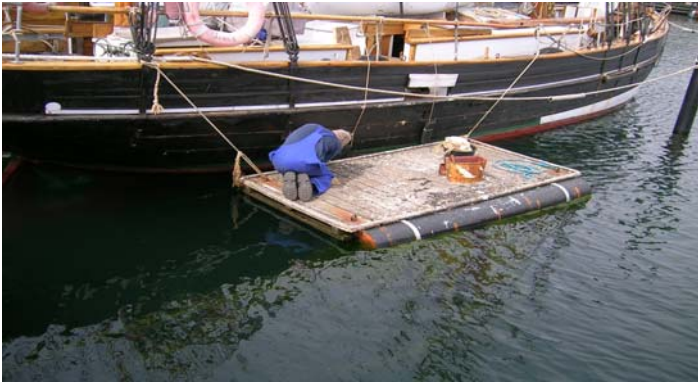
Fortuna under klargøring