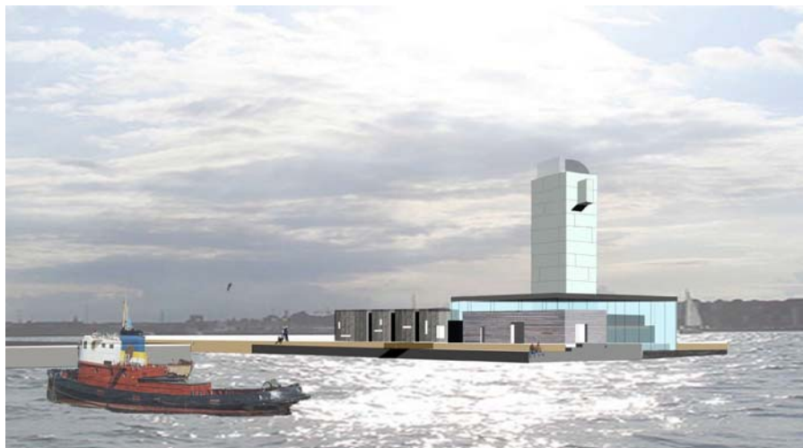
Et Søfartsmuseum i Århus (se side 5)