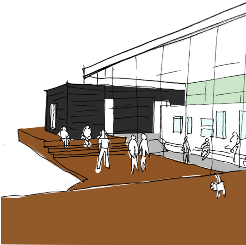
Interiørskitse af café og udstilling

Nybygningerne udgør et areal på ca. 700 m 2 , og sammen med de eksisterende bygninger vil det samlede anlæg udgøre ca. 1250 m 2