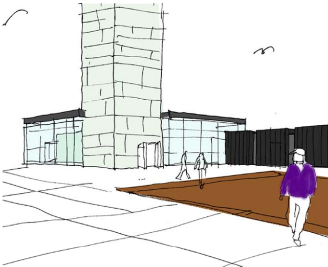
Skitse for opholdsplads set mod museum

I andre "huse" indrettes udstillingsplads med mulighed for fast og skiftende udstillinger, både i små og intime rum, "køjerne" og i større rum med plads til store emner. I de store lokaler bliver der igennem store vinduer direkte kontakt ud til den nutidige havn med containerskibe og stor aktivitet. Her bliver også mulighed for på storskærme at følge skibstrafikken i danske farvande, og der bliver måske mulighed for at manøvrere et stort skib ind i Århus Havn, - dog kun i simulator.